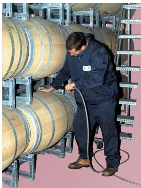
Facilité d'accès à la bonde pour le ouillage et le batonnage

Renfort en fer plat, évite les déformations